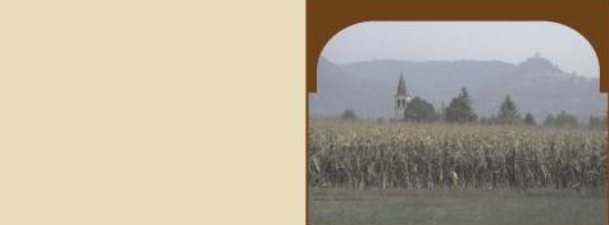
Madonna dei Prati