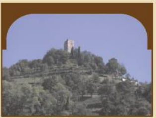
Rocca dei Vescovi